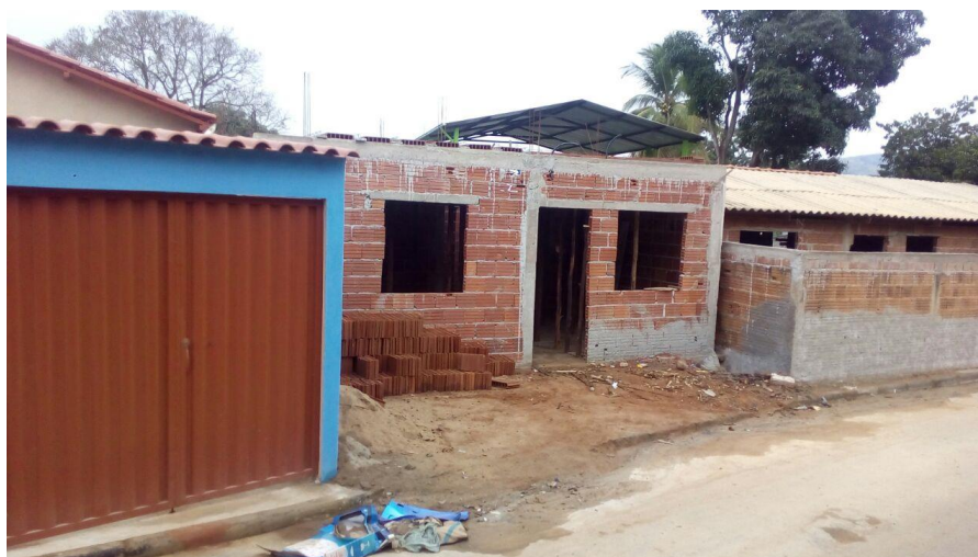
Figura 1. Registro fotográfico da visita.

No dia 10/06/2017, equipe técnica da empresa Synergia, enviou SMS para os números declarados pelo manifestante, com o objetivo que a família entre em contato com a empresa para realização do Cadastro Integrado.